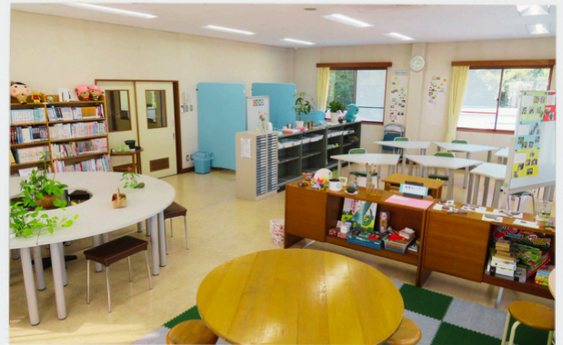
みんなのまなびば マイルーム 佐野市戸室町689-1