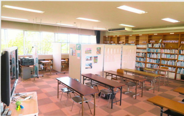
みんなのまなびば アクティヴ 佐野市上羽田町1134-1(教育センター2階)

「みんなのまなびば アクティヴ・マイルーム」は、登校に不安のある児童生徒の一人ひとりに寄り添い、一緒に考える場所です。さまざまな活動を通し、経験を重ね、人と人とのかかわりを大切にしながら成長できるようにしていきます。そして、一人ひとりの思いや願いを大切に、社会的自立を支援します。