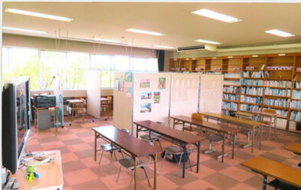
みんなのまなびば アクティヴ 佐野市上羽田町1134-1(教育センター2階)

「みんなのまなびば アクティヴ・マイルーム」は、登校に不安のある児童生徒の一人ひとりに寄り添い、一緒に考える場所です。さまざまな活動を通し、経験を重ね、人と人とのかかわりを大切にしながら成長できるようにしていきます。そして、一人ひとりの思いや願いを大切に、社会的自立を支援します。