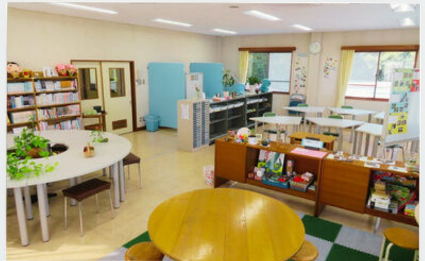
みんなのまなびば マイルーム 佐野市戸室町689-1